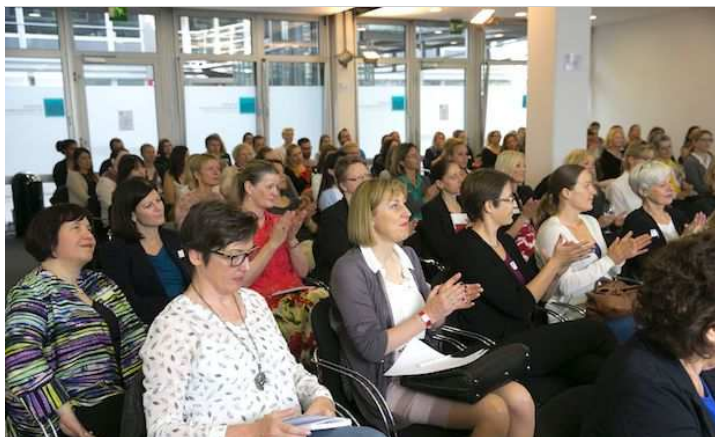
Rund 120 Teilnehmerinnen und Teilnehmer kamen zum Stuttgarter Frauen-Forum der FOM Hochschule.